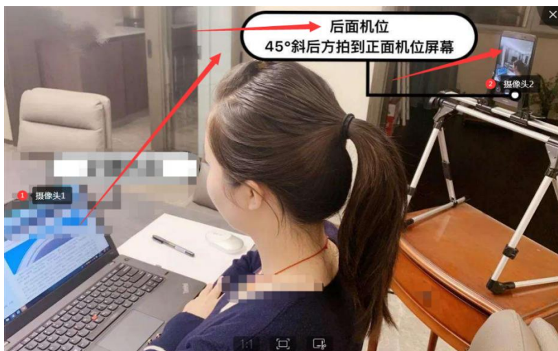
（线上比赛双路摄监考形式）

http://www.ncccu.org.cn/index/Cms/content.html?id=249