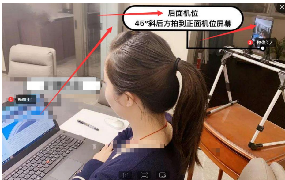
（线上比赛双路摄监考形式）

本次竞赛分为线上比赛和线下集中统考的两种形式，线上比赛（双路摄像监考）不限比赛场地，参赛选手可根据自身情况在封闭无他人的教室、宿舍、家中等处进行。线下集中统考需要院校负责老师提供线下机房或教室供考生集中参赛。