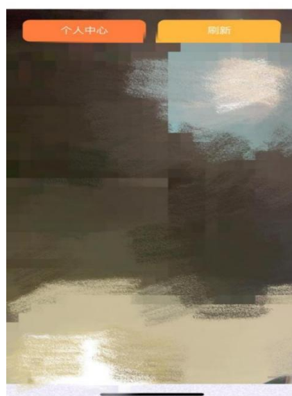
手机端摄像头页面